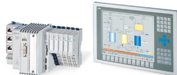
PLC ve OPERATÖR PANELLERİ