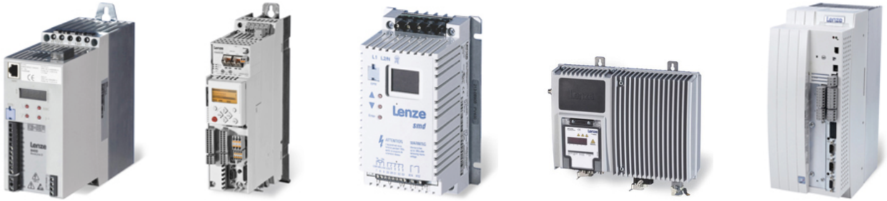
8200, 8400, SMD, SMV, PROTEC SERİSİ HIZ KONTROL CİHAZLARI

Teknik konular için; Erman AYDEMİR +90 530 010 86 74 / erman@gny.com.tr Hüsnü Alpkan GÜNAY+90 532 614 48 29 / alpkan@gny.com.tr